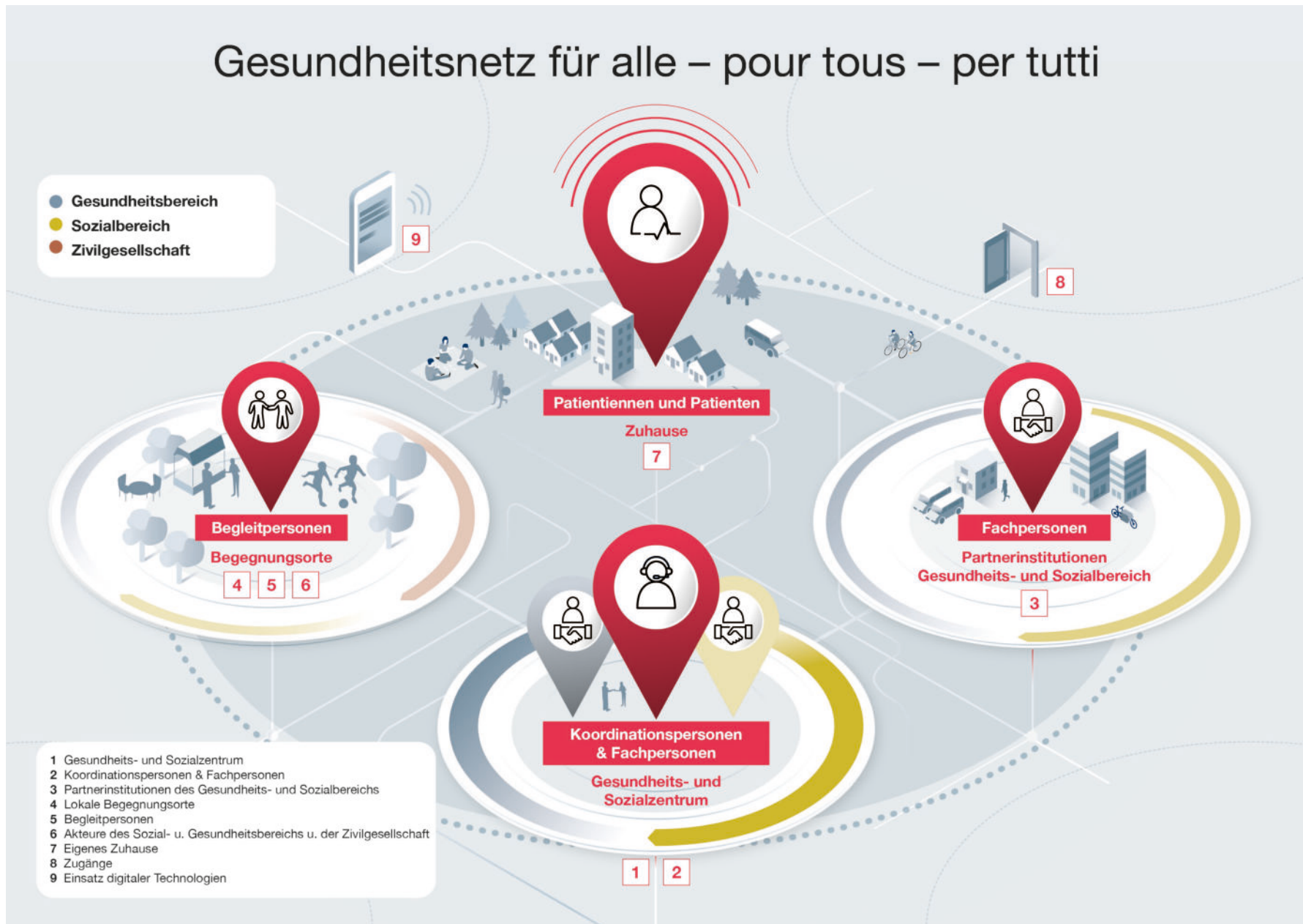
Abbildung 1: «Gesundheitsnetz für alle – pour tous – per tutti»