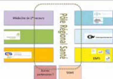
Schéma Pôle Régional Santé

En suivant la méthodologie Hermès 5, l'année 2017 sera consacrée à la conceptualisation, l'année 2018 à la réalisation et l'année 2019 aux déploiements cliniques. Dès 2021, les différents partenaires pourront intégrer des locaux attenants les urgences hospitalières à Yverdon-les-Bains.